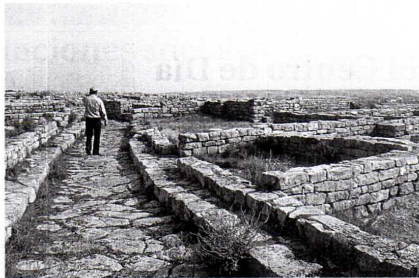
El Cabezo de Alcalá constituye uno de los máximos exponentes iberos de la región. L.C.

El retraso en la puesta en marcha de los trabajos responde a la confluencia de diferentes situaciones. Por un lado, las condiciones del proyecto que establecían que "el 50% del mismo corriera a cargo de un arqueólogo y la otra parte firmado por un arqui-