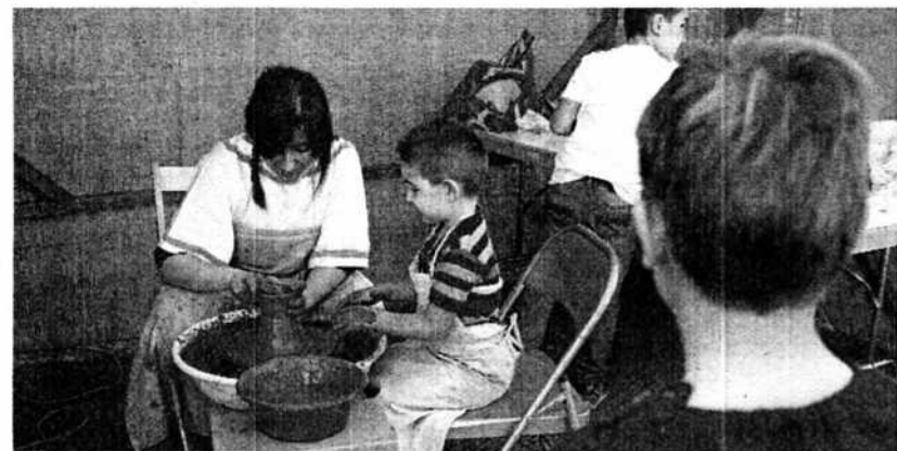
Los niños aprendieron a modelar con barro en uno de los talleres de Sedeisken. B. SEVERINO