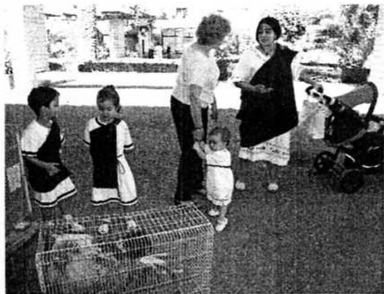
Los animales de corral que llegaron de Caspe fueron la atracción.